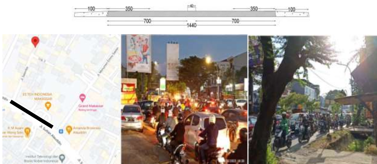
Gambar 1. Potongan melintang jalan dan lokasi penelitian

Ruas Monumen Sultan Alauddin Emmy Saetan. Lokasi penelitian digambarkan pada Gambar 1, tipe jalan 4/2 UD, dengan lebar jalan 7 m (1 lajur/jalan) dan panjang ruas tinjauan 140 m. Pada hari Selasa, Kamis, dan Sabtu, survei penelitian berlangsung selama tiga hari. Pengumpulan informasi dilakukan mulai pukul 07.00 hingga 19.00 WITA. Ini dibatasi pada jam sibuk dari jam 7 pagi hingga 10 pagi, jam 11 siang hingga 1 siang dan jam 4 sore hingga 7 malam, selang waktu lima belas menit. Selasa dan Kamis digunakan untuk menyampaikan hari kerja dan hari sabtu sebagai hari libur.